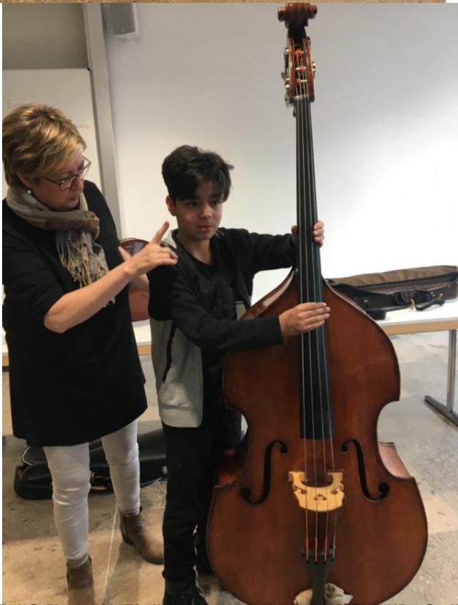
Ein Gedächtnisprotokoll wurde für die Schüler erstellt, um die Instrumente zu identifizieren und dabei